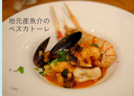
地元産魚介の ペスカトーレ