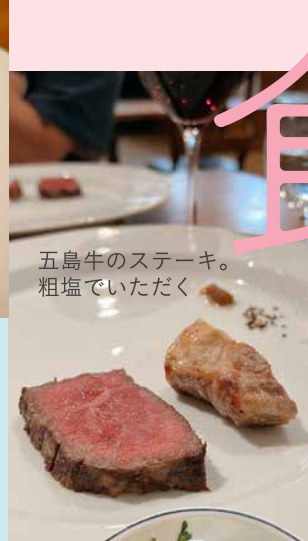
五島牛のステーキ。 粗塩でいただく