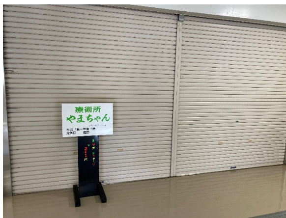
療術所（足つぼマッサージ）