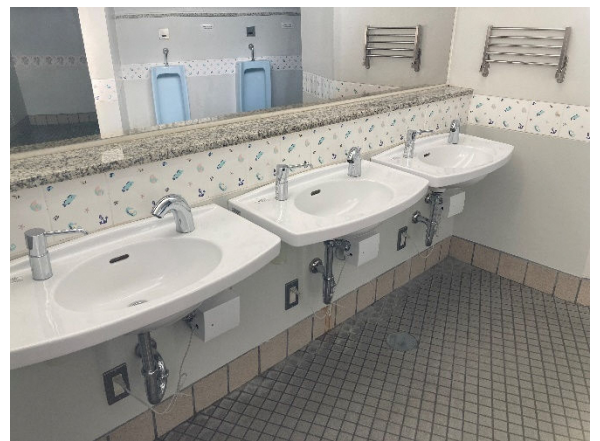
男子トイレ洗面所