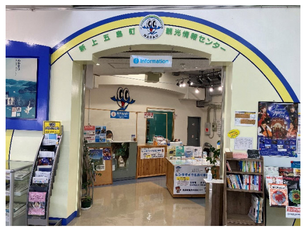
観光情報センター